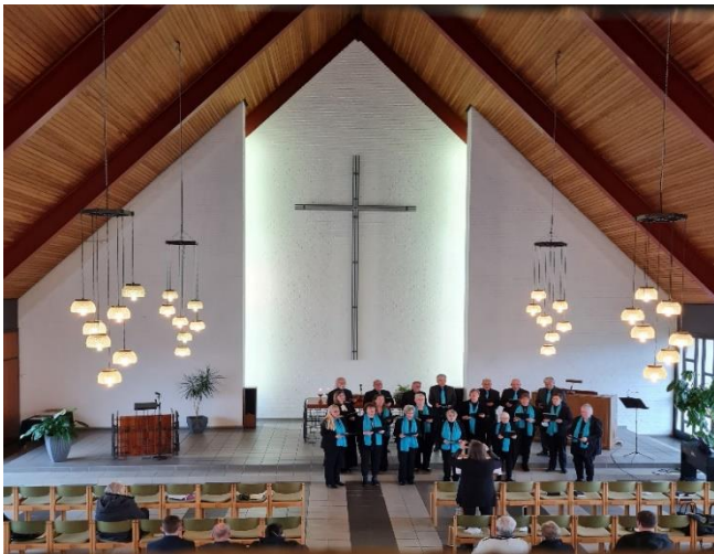
Karfreitaggottesdienst mit Abendmahl

Wer Lust und Zeit hat den Sopran, Alt, Tenor oder Bass zu unterstützen ist immer donnerstags ab 19.30 Uhr in der Zeltkirche in Gerderath herzlich willkommen.